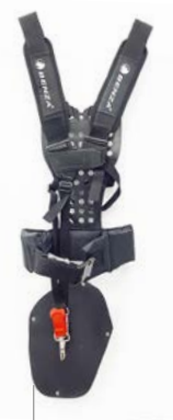
Arnés acolchado profesional